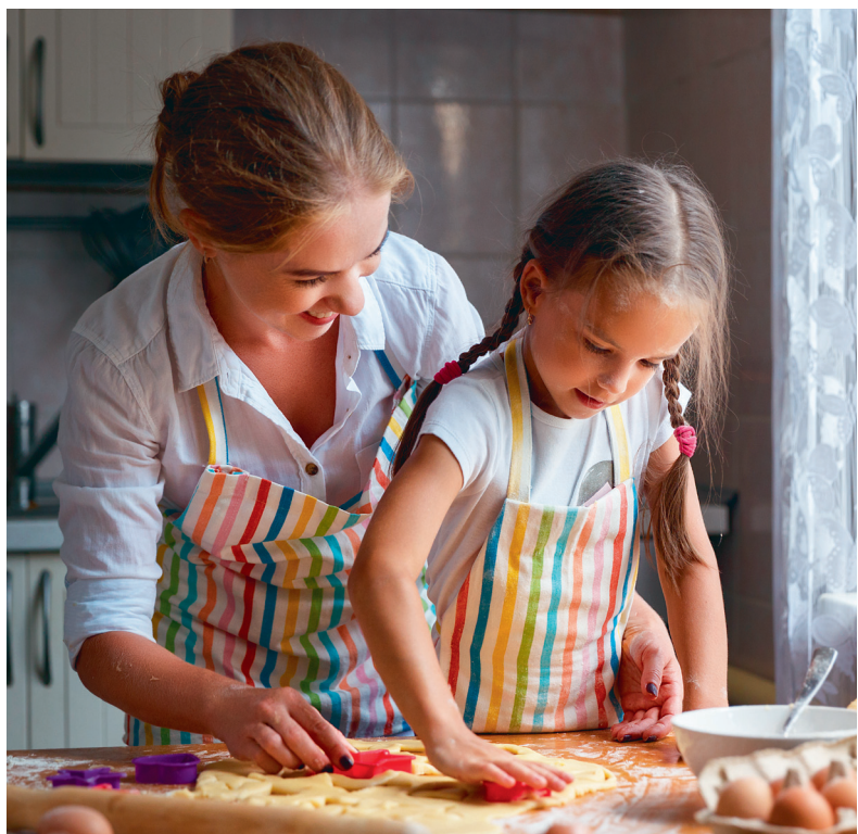
Кухня - место для общения и совместного кулинарного творчества.

вильно распределить квадратные метры, чтобы использовать их на все 100%. Можно выбрать планировку с компактной кухней и большой комнатой или же предпочесть квартиру с комнатой поменьше, но просторной кухней-гостиной. У каждого варианта свои плюсы. Какой выберете вы?