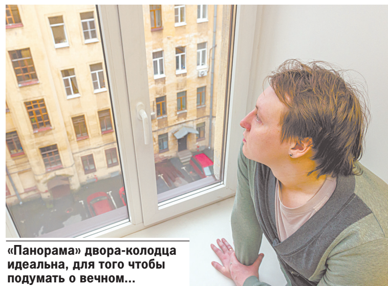
«Панорама» двора-колодца идеальна, для того чтобы подумать о вечном...

Любопытный факт: раньше двор-колодцы считались изнанкой Северной столицы - вид у них был очень неблагопристойный. Поэтому некоторые более-менее со-