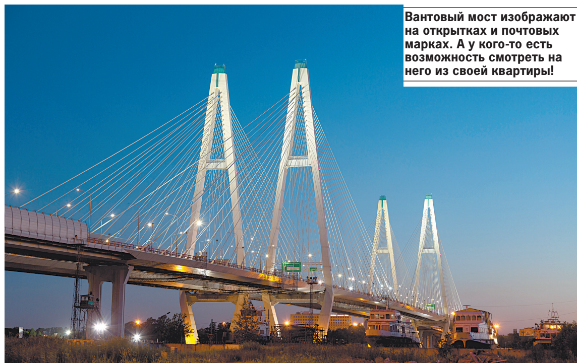
Вантовый мост изображают на открытках и почтовых марках. А у кого-то есть возможность смотреть на него из своей квартиры!

тают жители бывшей коммуналки на Петроградке, - простор.