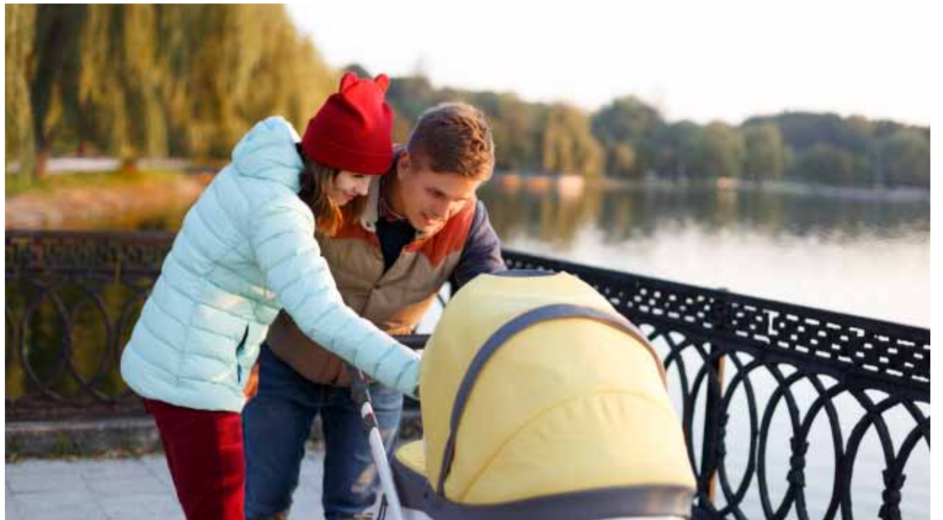
Программа материнского капитала станет удобнее

– Мы делаем этот вывод исходя из того, что на протяжении всего периода времени из общего количества семей, которые получили или приняли решение воспользоваться материн-